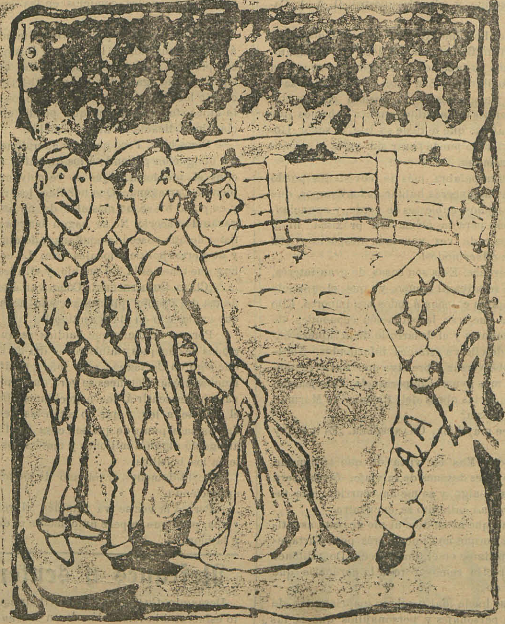
A. A.—¡Ahí va, Señores! Los empleados.—¡Ay mi madre, y qué marrajo que nos va á soltar este tío!...