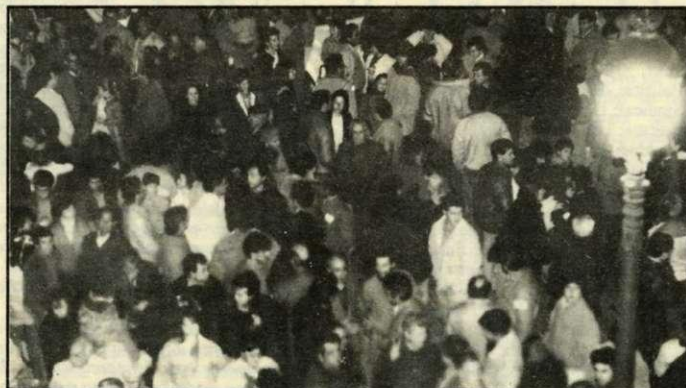
Miles de yeclanos reivindicaron un convenio justo

Más del 90% de la población secundó el paro en esta jornada, convocado en apoyo a la negociación del convenio de la madera. Los comercios, colegios, bancos, bares, Ayuntamiento, etc. cerraron durante las 24 horas. También se suspendió el tradicional mercadillo del miércoles.