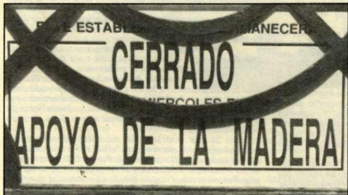
Muchos establecimientos comerciales permanecieron cerrados exhibiendo un cartel como el que muestra la fotografía