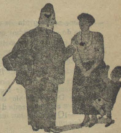
—¡Ja ve, qué suerte! Con dos y ha tocado un reloj en la rifa. —¿Y con la otra qué le ha tocado?