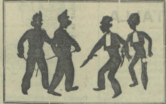
Vino, navajas, chulos y guardias de orden público.