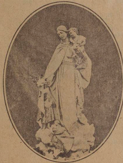
Ntra. Sra. de los Desamparados

dió principio el día 2 del presente mes, a las nueve de la noche; y a la misma hora ha continuado los demás días. Todo cuanto se diga de la solemnidad y devoción que han revestido estas novenas, es poco. Todas las noches