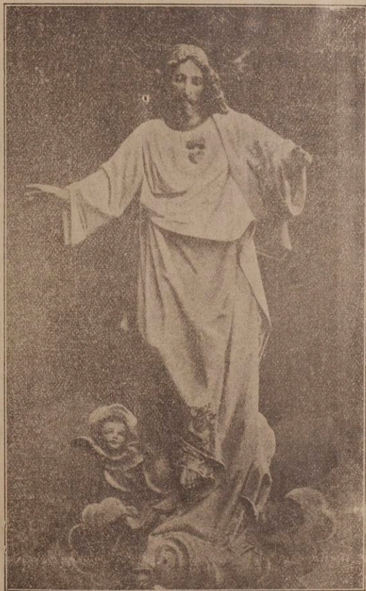
Mira este Corazón que tanto ha amado a los hombres (Sta. Margarita)

que tenemos que es nuestro corazón, que es nuestro amor.