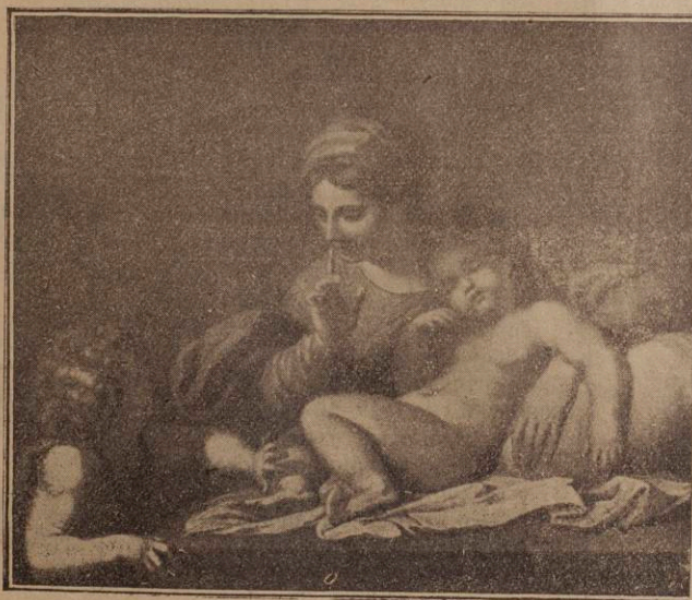
Jesús duerme tranquilo entre los brazos de su Madre