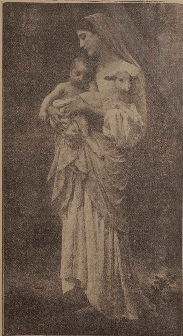
La más bella flor de Mayo