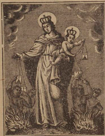
Nuestra Señora del Carmen