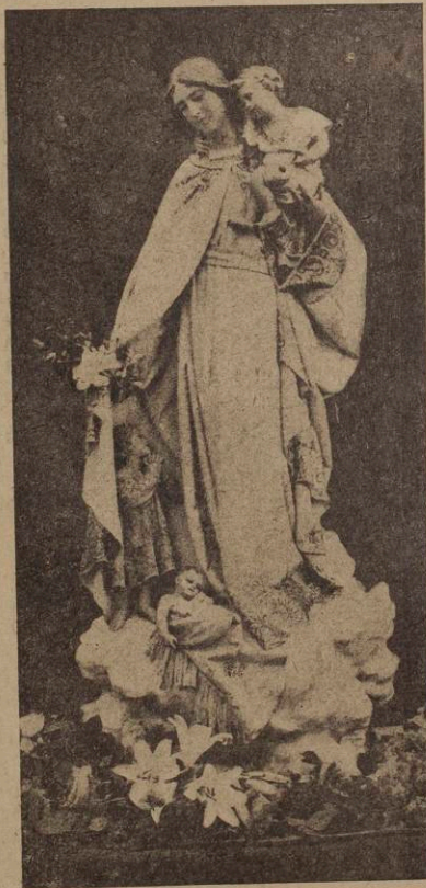
Virgen de los Desamparados, venerada en el Ral de Alhama de Murcia

¿Y los cultos? En el rito litúrgico, cabe, no lo dudo, mayor solemnidad; negarlo sería insensatez; mas si digo que, atendidas las circunstancias, aquí no cabe más: ¡qué orden! ¡qué armonía! ¡qué lindeza en los cánticos! y