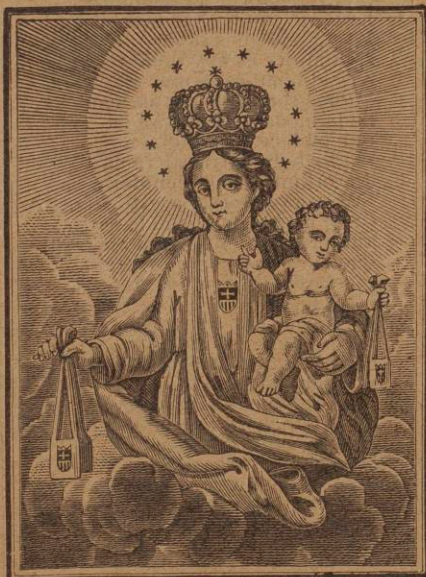
Ntra. Sra. de las Mercedes

mente sus ojos y asentó sobre la dura piedra en que había yacido cuatro o cinco horas, sin duda alguna luchando con Morfeo, porque manifestaba hallarse muy quebrantado. Adiviné que mi catadura no le debió agrandar mucho, porque, verme y entornar los ojos, fué cosa instantánea. Quedó así un momento, como recapacitando en su interior y poco a poco se fué animando, aunque sin levantar la vista del suelo. Hizo un cigarrillo; me alargó la petaca; yo