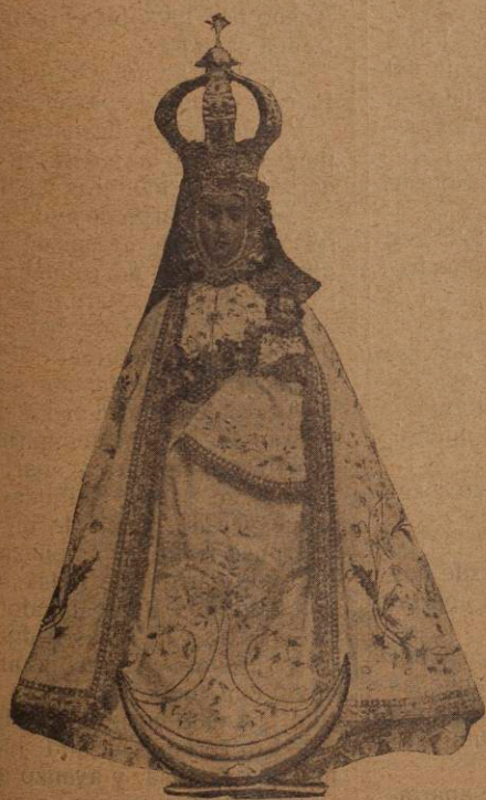
Nuestra Señora de la Consolación

Es el día de la Ascensión del Señor a los Cielos, el consagrado en la Diócesis para celebrar en él la fiesta alegre y simpática de la primera Comunión de los niños. Día, que si en la Liturgia de la Iglesia figura como uno de las festividades más solemnes del año, como dice un cantar popular, no deja de ser también grande y solem-