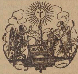
ALABADO SEA EL SANTÍSIMO SACRAMENTO DEL ALTAR

Y no solamente muere una vez Jesucristo, por nosotros, sino tantas veces cuantas se inmola místicamen-