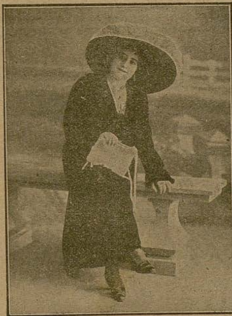
Notable primera actriz que actúa con gran éxito en el Salón Ideal

Con esa elegancia y naturalidad que le son característica, empezó el desarrollo de su papel, destacándose de un modo asombroso en la escena que aparece en el último grado de tuberculosis, retratando esta enfermedad de una manera maravillosa, llevándonos con ello á un completo arrobamiento.