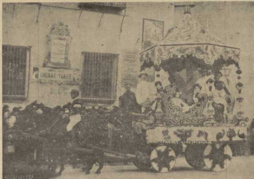
EL TIO VIVO

Esas reformas serían funestas para los que visten la honrada toga de Abogado, pero aun más