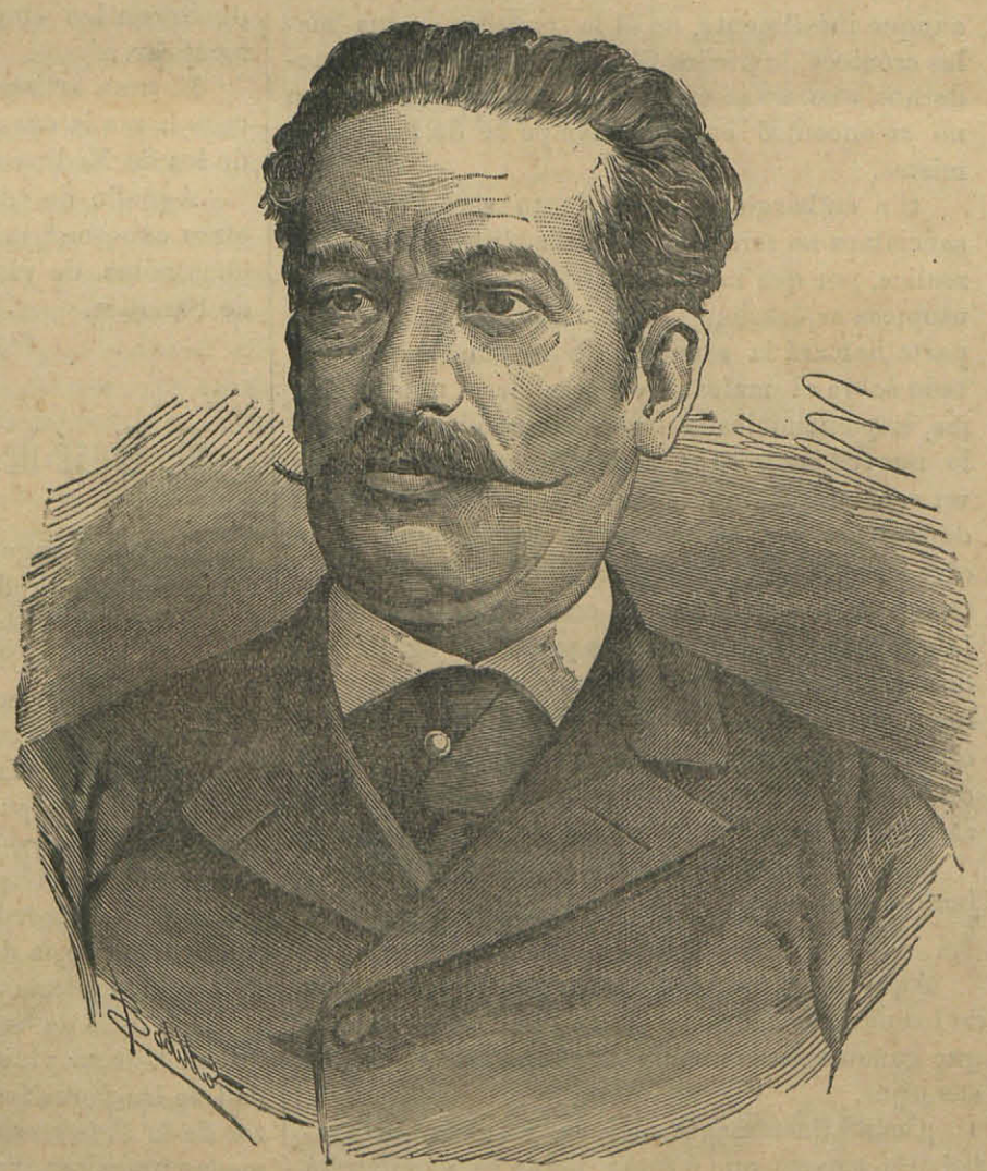
D. José de Selgas y Carrasco.