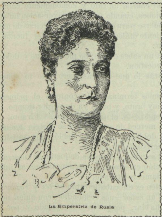
La Emperatriz de Rusia

Primero el gran duque de Baden, después el de