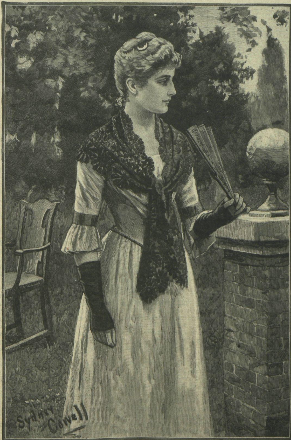
DÍAS DE VERANO