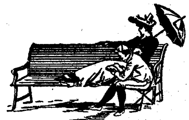
Lo que es.

Es verdad que muchas veces los astrónomos se equivocan y cuando anuncian lluvia brilla un sol de justicia.