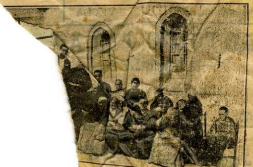
nuestros redactores el Hbate Sauco, f.

—Pero ahora verán—nos dicen—ahora verán el estado del patio, se halla verdaderamente ruinoso.