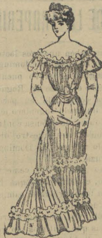
Traje de sociedad