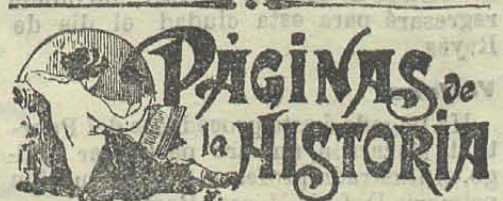
PAGINAS de la HISTORIA

Dicen, y dicen bien, que una conjura contra el gobierno apadrinado por don Páco, sería una conjura contra él y quedaba inutilizado, por lo menos moralmente para continuar siendo jefe de la Unión conservadora.