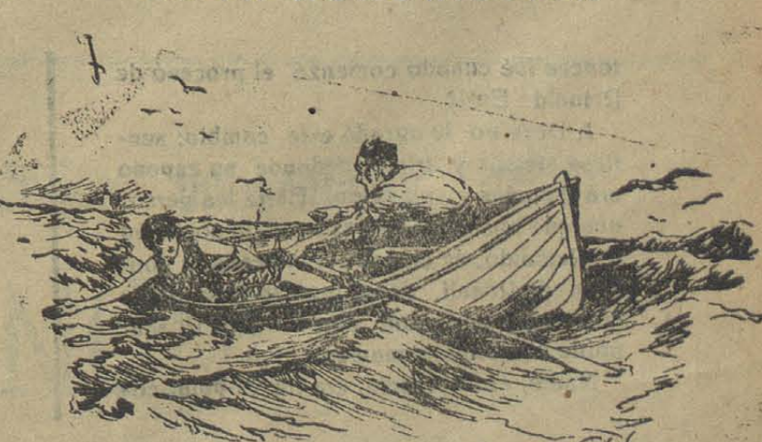
—¡No te echés así, que vamos a pique! —¡Es para avisar que tomamos la vuelta!