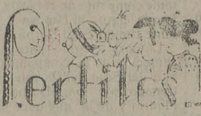
Un grave error

Dada la cultura del conferenciante, sus amplios y extensos conocimientos sobre la Literatura y el Arte Árabigos, y su brillante manera de exponer, es de esperar que dicha conferencia constituya un brillante éxito, como ya lo