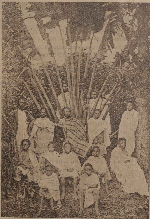
INDIOS A LA SOMBRA DE UN PLÁTANO, ESPERANDO AL MISIONERO QUE LES ANUNCIE LA BUENA NUEVA