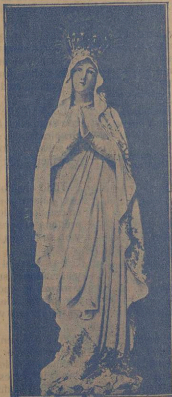
Yo soy la Inmaculada Concepción

mo la perla más preciosa que se engarza en su real corona.