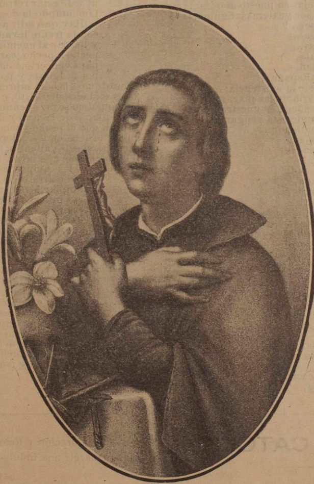
EL ANGÉLICO PATRONO DE LA JUVENTUD SAN LUIS GONZAGA

En ellos funda su esperanza la Iglesia, que tendrá en ellos sus más firmes defensores y la Patria, porque serán hombres cultos, cristianos y honrados, base firmísima sobre que descansa el patriotismo de un pueblo.