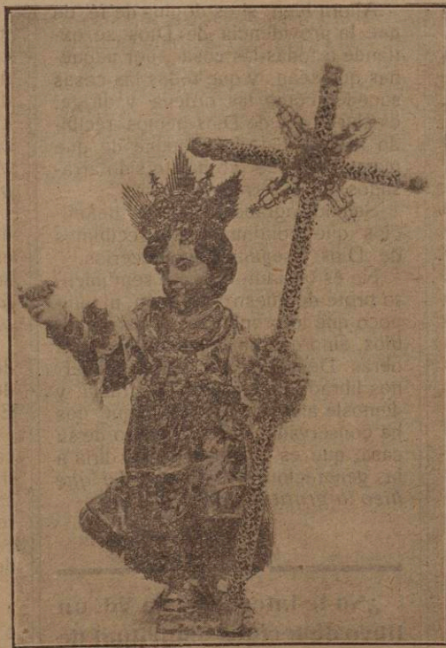
El Niño Jesús de Belén