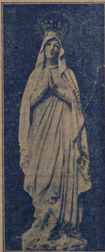
"Yo soy la Inmaculada Concepción"

Este año se cumple el septuagésimo quinto aniversario de la declaración dogmática del misterio