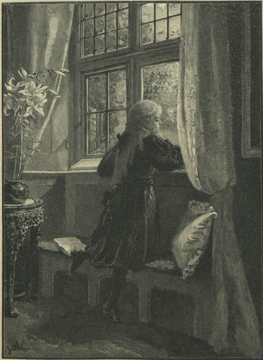
DETRÁS DE LOS CRISTALES