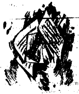
ALFONSO PEREZ NIEVA (Prohibida la reproducción)

—¡Puedes despedirte de tus proyectos! ¡No entrarás ya nunca de ahí, de ser un clarinete de tres pesetas!