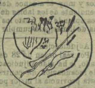
Varias formas de bacterias de la boca.

De allí se deduce lógicamente, para toda persona dotada hasta de mediana inteligencia, que si se quiere preservar los dientes del peligro de cariarse, es preciso reducir á la impotencia esas bacterias. Hace un siglo, cuando aparecieron la mayor parte de los dentíficos todavía usados hoy día, se ignoraban totalmente la existencia y el trabajo de estos microbios, que hoy, por confesión unánime de los sabios del mundo entero, son reconocidos como causantes de la descomposición y de la caries de los dientes. No se pudo dar, pues, 100 años atrás con otra cosa que con pobres dentíficos que perfumaban algo la boca, pero que no podían menos de dejar corromperse los dientes. La ciencia moderna, al contrario: no sólo ha hallado la verdadera causa de la caries, sino que al