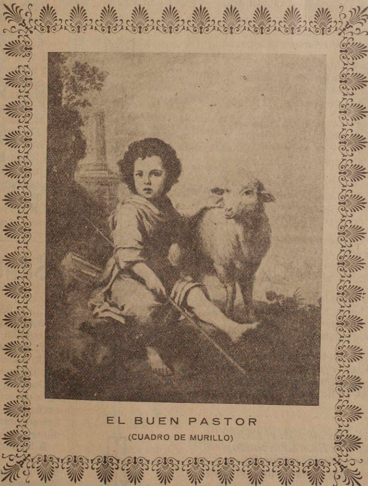
EL BUEN PASTOR (CUADRO DE MURILLO)

Que Dios Ntro. Señor premie a nuestro bondadoso Sr. Obispo tanta generosidad y dé el ciento por uno a cuantos han contribuido con sus limosnas a la realización de estas obras y nos infunda a todos alientos para no desmayar en preparar digna morada al Bendito Prisionero del río: al Dios de la Eucaristía.